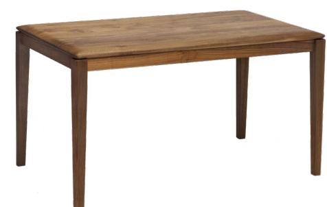
walnut W100 D60 H55

ソファに座っても使いやすい高さ 55cm H39~55cm : +6,600 円 (税込) * oak / walnut 共通