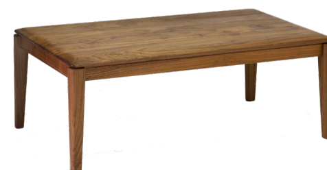
walnut W100 D60 H38