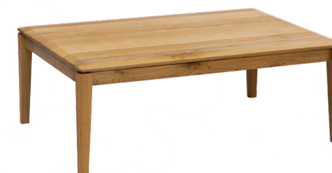
oak W100 D60 H38