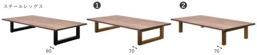
スチールレッグス

ウッド2・4レッグス：無垢材（天板同材） / オイル仕上げ アジャスター付（2レッグスのみ）